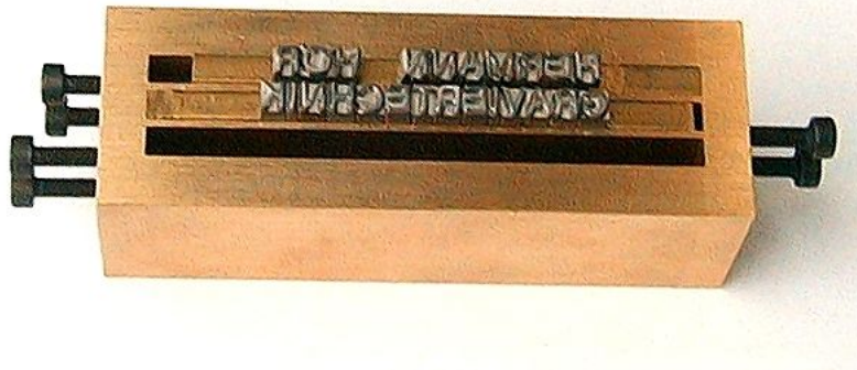
Spannmaß Standard 3,92 mm type holder, clamping size 3,92 mm