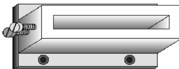
Ausführung mit Spannstege an den Längsseiten screwing bases lengthways